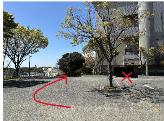
②地下駐車場には入らず建物の左側に入る