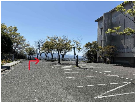
① 駐車場奥まで進む