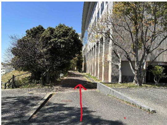
③ 建物に沿って奥まで進む