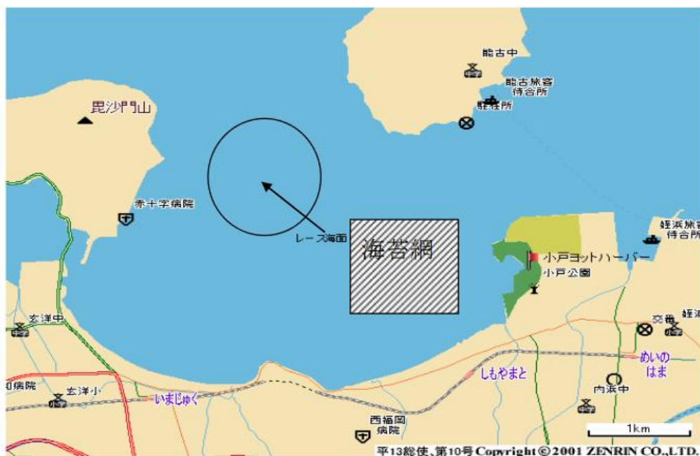
添付図A：レースエリア

RRS3には『レースに参加するか、またはレースを続けるかについての艇の決定の責任はその艇のみにある。』とある。大会に参加することによって、それぞれの競技者は、セーリング競技に内在するリスクがあり、潜在的な危険を伴う行動であることに合意し、認めることになる。これらのリスクには、強風、荒れた海、天候の突然の変化、機器の故障、艇の操船の誤り、他艇の未熟な操船術、バランスの悪い不安定な足場、疲労による傷害のリスクの増大などがある。セーリング・スポーツに固有なのは、溺死、心的外傷、低体温症、その他の原因による一生消えない重篤な障害、死亡のリスクである。