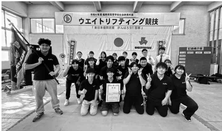
令和6年度インターハイ福岡県予選優勝 光陵高等学校

方、各学校の顧問の先生、運営に携わっていただいた、皆様におかれましては、今年度が無事に終了できましたことを厚く御礼申し上げます。そして大会や事業を企画運営していく中で多くのご迷惑をおかけしてしまい申し訳ありませんでした。今後もますますの発展のために皆様にはお願いやご負担をおかけすることがあると思いますが、どうぞよろしくお願いいたします。