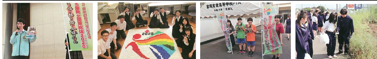
令和2年度全国高等学校総合体育大会 群馬県高校生活動の記録「虹色の轍」より抜粋